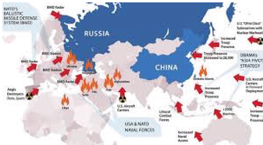
Figure 1: Bilden av kartan är hämtad från artikeln "Cold War, Today, Tomorrow, Every Day Till the End of the World" av William Blum.